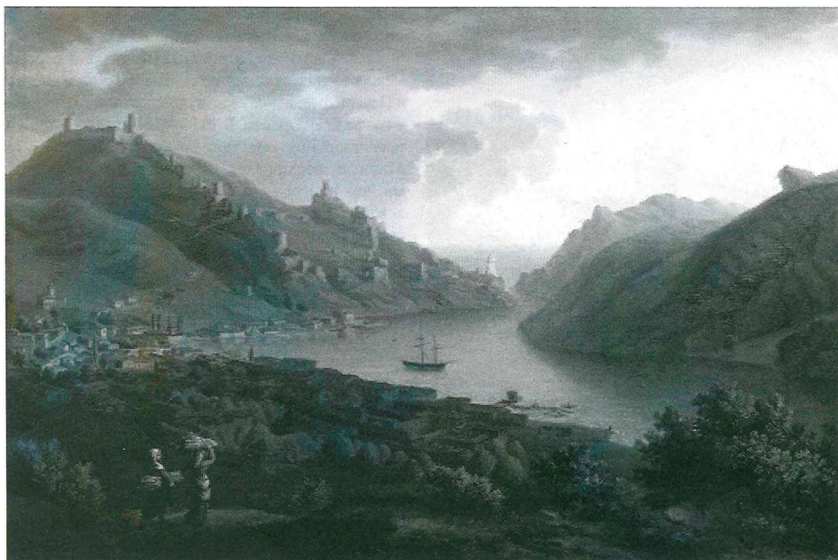
Жан-Кристоф Мивиль Балаклава

Крымские пейзажи кисти Мивилля отличаются топографической точностью, при этом в панорамные виды им включены и архитектурные мотивы, и жанровые сцены. Но главное в этих пейзажах все же горы и воды, зелень и небеса, многообразная и благодатная крымская натура, сама по себе эмоционально окрашенная.