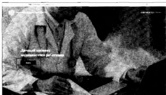
Рисунок 1. Стартовая страница личного кабинета медработника

На стартовой странице нажмите кнопку «Войти» (рисунок 1). Увидите форму авторизации (рисунок 2). Она привязана к portalу «Госуслуги». В верхнем поле