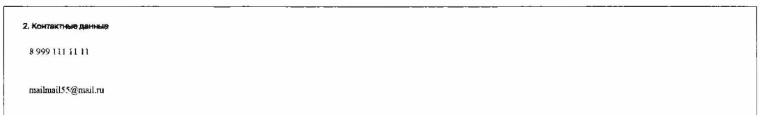
Рисунок 4. Поле «Контактные данные»