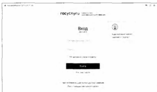
Рисунок 2. Форма авторизации