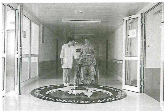
Рисунок 1. Сопровождение на кресле-каталке

Научите медсестер, как эргономично организовать рабочее место. Так, стол и стулья должны быть такой высоты, чтобы запястье и рука находились на одной высоте, а между крышкой стола и ногами был просвет. Спинка стула должна поддерживать пояснич-