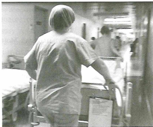
Рисунок 2. Перемещение на каталке