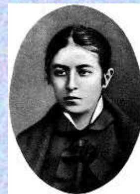
Вера Николаевна Фигнер, 1883г.

И. М. Сеченов выразил надежду, что Сулова «получит возможность найти применение своим знаниям в собственном отечестве». Но такой возможности ей не дали даже после того, как Надежда подтвердила на родине докторскую степень. Несмотря на то, что в июле 1868 г. в «Журнале комитета министров» было опубликовано сообщение о том, что Суловой предоставлены права свободно практикующего врача, ни к преподавательской, ни к научной деятельности она не была допущена. Оставалось два пути: уехать в Европу и там заниматься наукой или остаться в России, довольствуясь скромной должностью практикующего врача. Сулова, не задумываясь, выбрала второе. И стала единственной в Петербурге, женщиной, занимающейся врачебной практикой. По свидетельству современников, пациенты души не чаяли в очаровательном докторе.