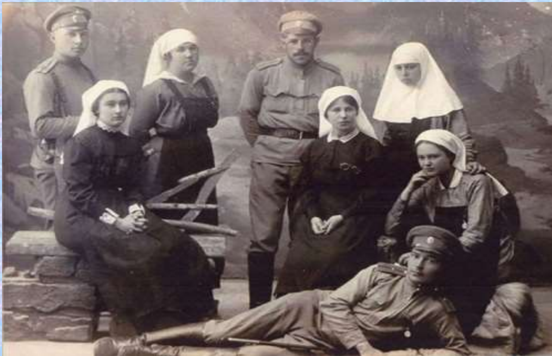
Выпускницы Высших женских врачебных курсов на фронте

Главным делом Надежды в эти годы стало создание фельдшерских курсов для женщин. Именно она разработала программу обучения, нашла средства и привлекла к преподаванию опытных коллег. Открытые ею при Екатерининской больнице женские фельдшерские курсы незаметно для властей трансформировались в курсы учёных акушеров при Медико-хирургической академии. По сути это было настоящее высшее учебное заведение с четырёхгодовичным сроком обучения. Лекции читали выдающиеся профессора. Но, несмотря на это, выпускницам не давали права на врачебную практику. И снова Надежда Суслова проявила настойчивость, которая увенчалась созданием весной 1876 г. официальных Высших женских врачебных курсов на базе женского и детского отделений Николаевского военного госпиталя.