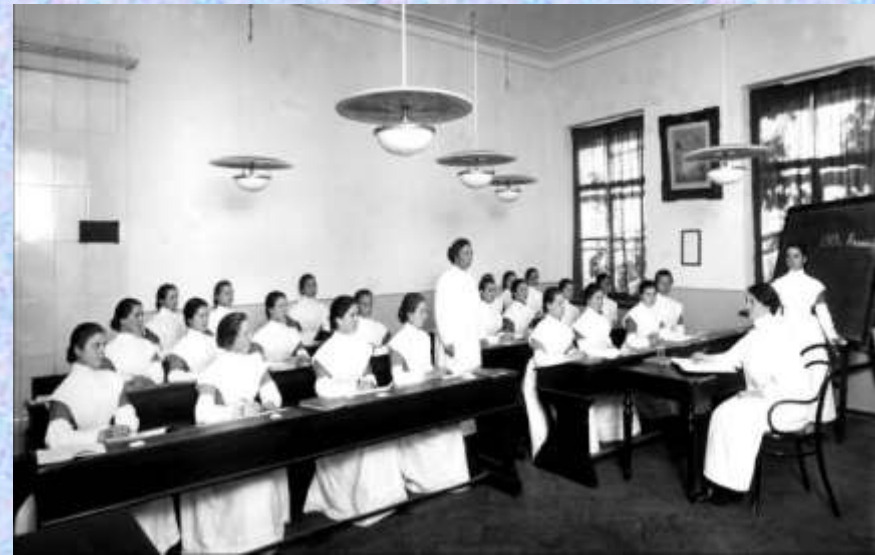
Урок в школе няnek. Воспитательный дом (Санкт - Петербург)

Примерно в это же время (1854 г.) в Петербурге возникает первое собственно фельдшерское училище, куда, в свою очередь, принимались воспитанницы Петербургского воспитательного дома в возрасте от 15 до 18 лет - всего до 20 человек. В первые два года они выслушивали теоретическую часть, в программы училища входили курсы по анатомии, физиологии, фармакологии, рецептуре, десмургии, частью хирургии. На третий и четвертый год обучения полагалась практика, проходившая в нескольких больницах Петербурга.