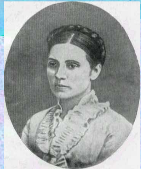
Аполлинурия Сулова, Возлюбленная Достоевского

Родилась Надежда Сулова далеко от Крыма - в селе Панино Нижегородской губернии в семье крепостного крестьянина. Батюшке будущей знаменитости повезло: он не только получил вольную от графа Шереметева, но и стал владельцем фабрики по производству бумаги и ситца. Это позволило дать дочерям - старшей Аполлинару и младшей Надежде приличное первоначальное образование в пансионе в Москве.