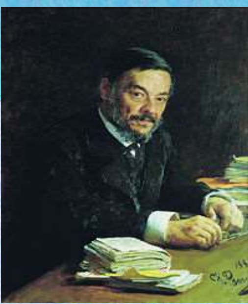
Иван Сеченов. Портрет работы И. Репина (1889)