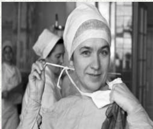
Н. В. Троян

Самоотверженно перевязывала и выхаживала раненых партизан. В рядах подпольной организации девушка участвовала в операциях по взрыву мостов, нападении на вражеские обозы, и боевых действиях. За образцовое выполнение боевого задания в тылу противника и проявленные при этом отвагу и героизм Надежде Викторовне было присвоено звание Герой Советского Союза .